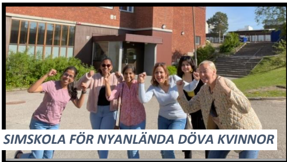
SIMSKOLA FÖR NYANLÄNDA DÖVA KVINNOR