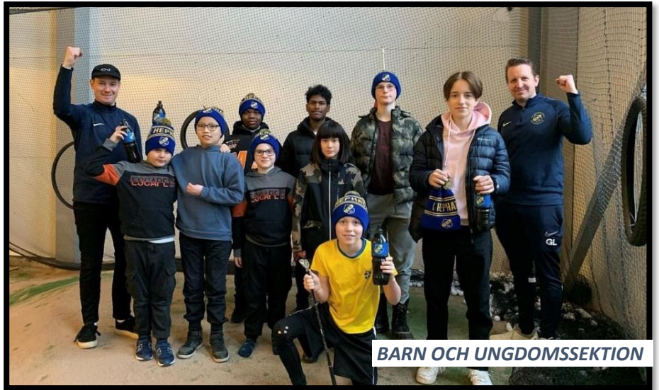
BARN OCH UNGDOMSSEKTION